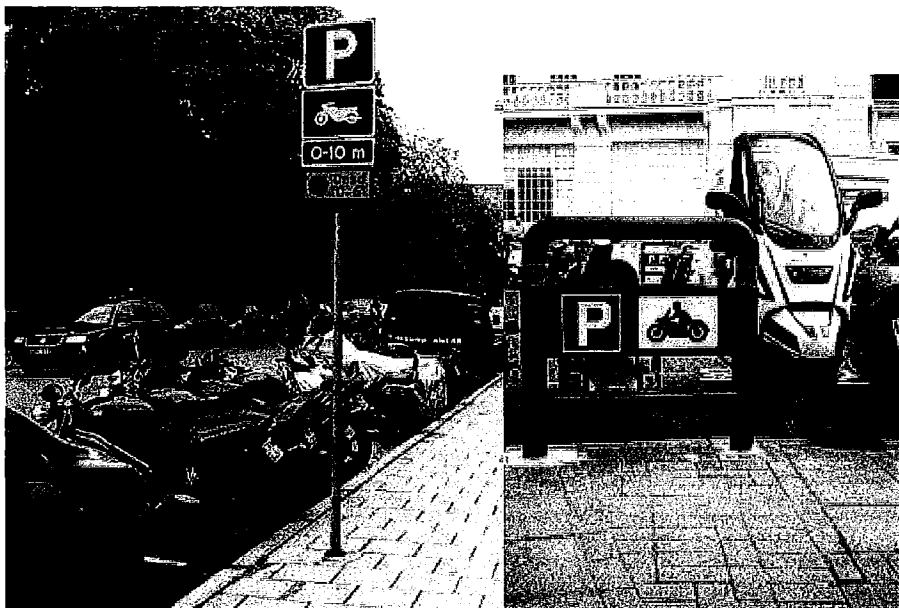
Överst: MC-parkering i Stockholm, nedre bild MC-parkering i London

I augusti 2011 skrev SMC en nyhet om en tingsrättsdom i Örebro som parkerade på privat tomtmark men fick parkeringsanmärkning då man ansåg att tomtmarken var gångbana. MC-ägaren fick bidrag ur Rättsfonden för att driva ärendet men fick avslag i Tingsrätten. Läs mer här .